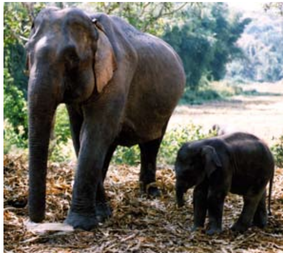
Övergångsställe för elefanter i Petchabunprovinsen i norr.

Yai, just i Dong Phaya Yen. Sedan dess har ytterligare fem områden i närheten fredats. Men illegal skogsavverkning fortsätter och många välbärgade Bangkokbor har byggt fritidshus inne i nationalparkerna. Trafiken är också så intensiv att den stör de vilda djur som finns kvar. För fortfarande finns det apor, vilda kattdjur, elefanter, hjortar och vildsvin i Thailand. 2005 tog tigrar ett par kor på berget bakom byn där jag bor, nordöst om Chiang Mai. Det var första gången något sådant hänt på många år, så det orsakade uppståndelse. Somliga bybor ville skjuta tigrarna medan andra var positivt överraskade av att det fortfarande fanns stora kattdjur kvar i området.