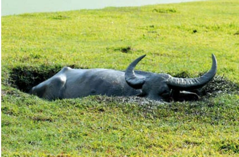
Vattenbuffeln tar sig ett gyttjebad för att bli av med ohyra.

Mai. Det är bland annat därför jag har hundar. De får vittring på ormarna så snart de tagit sig in på gården och skäller som besatta.